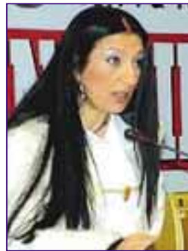
Γράφει η Ρόζα Βιδάλη

πνευματική γύμνια των ηγητόρων μας κατόρθωσε, να μας φέρει στο σημείο να φωνάζουμε ότι «φταίνει οι άλλοι» για την εξασθίωσή μας, αφαιρώντας ύπουλα την ικανότητα χρόνια τώρα να προσπαθούμε ΕΜΕΙΣ για ΤΟ ΚΑΛΥΤΕΡΟ- ΤΟ ΔΙΚΑΙΟΤΕΡΟ- ΤΟ ΑΥΤΟΝΟΗΤΟ: