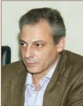
Του Γ. ΜΠΟΥΚΟΥΡΑ προέδρου ΠΑΣΥΠ/ΔΕΗ

Η μεταβολή του τρόπου σκέψης αγγίζει σιγά-σιγά και το συνδικάτο και τις επιλογές του. Αποτελεί την αιτία που έχει διασπείρει πανικό στις τάξεις ορισμένων συνδικαλιστών ενόψει του συνεδρίου της Ομοσπονδίας και όχι μόνο. Γίνεται αντιληπτό ότι η ώρα της κρίσης πλησιάζει. Ότι θα κριθούν για τη δράση τους, τις προτάσεις τους αλλά και για το ήθος τους. Η σε παλαιότερες εποχές αυτονόητη επανεκλογή τους τίθεται σε αμφισβήτηση. Όσο πλησιάζει η μέρα της κρίσης οι συκοφαντίες, οι απειλές και οι υποσχέσεις θα αυξάνονται, θα με-