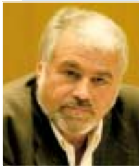
Κ. Πουπάκης Γενικός Γραμματέας ΓΣΕΕ

Ζ η προσήθη των μεταρρυθμίσεων στην ελληνική κοινωνία είναι απαραίτητη για να καταφέρουν οι δημόσιες επιχειρήσεις να επιζησουν μπροστά στον σκληρό παγκοσμιοποιημένο ανταγωνισμό. Αυτό το γνωρίζουν και οι εργαζόμενοι τους οι οποίοι δεν είναι ούτε τυφλοί, ούτε ανεύθινοι, όπως κάποιοι θέλουν να νομίζουν ή εκσεμμένα να υποστηρίζουν... Αντίθετα, το προσωπικό των ΔΕΚΟ ενδιαφέρεται πραγματικά για την τύχη των επιχειρήσεων που εργάζεται και