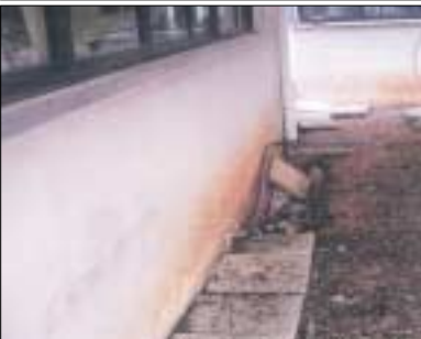
Ρωγμές από καθίζηση του κτιρίου.