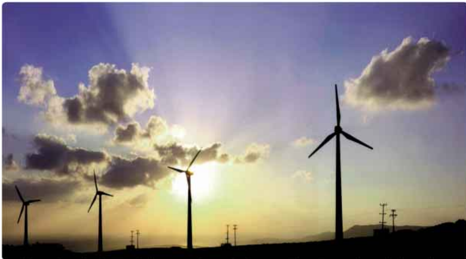
Αιολικό Πάρκο Μονής Τοπλού, Σητεία. Η δυναμική επέκταση στις Ανανεώσιμες Πηγές Ενέργειας, με επενδύσεις € 2 δισ., αποτελεί στρατηγικό στόχο του Ομίλου ΔΕΗ Α.Ε.