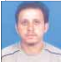
Γράφει ο Φώτης Μελέτης Αναπλ. Γραμματέας ΠΑΣΥΠ/ΔΕΗ

Η προσβλητική συμπεριφορά του σημερινού Αντιπροέδρου της κυβέρνησης Θ. Πάγκαλου με προκλητικές δηλώσεις εναντίον χιλιάδων δημοσίων υπαλλήλων αποδεικνύει περίτρανα το απύθμενο θράσος που διακατέχει τον Υπουργό των Ιμίων και της υπόθεσης Οτσαλάν.